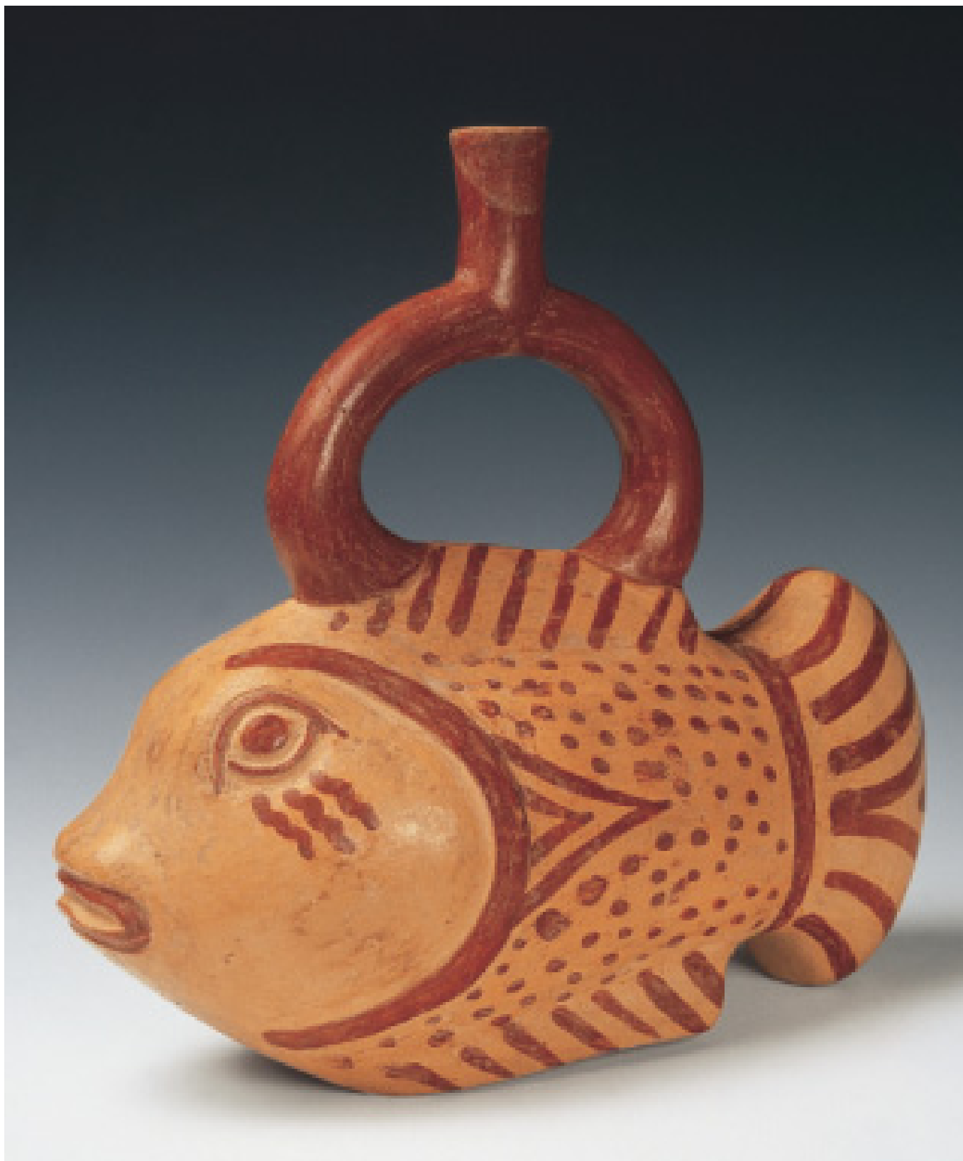
Fig. No. 104.- El bonito ( Sarda chilensis ). Museo Arqueológico Rafael Larco Herrera