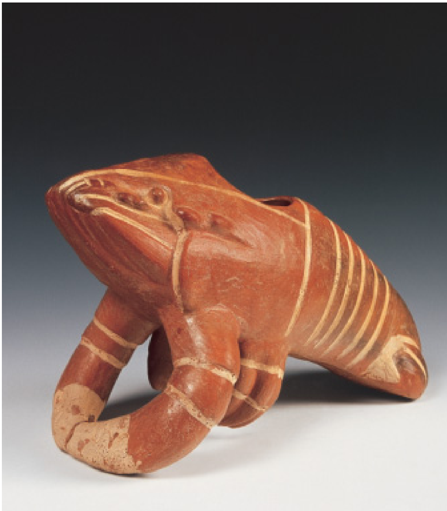
Fig. No. 108.- La langosta ( Polinostus frontalis ). Museo Arqueológico Rafael Larco Herrera (105-005-001)