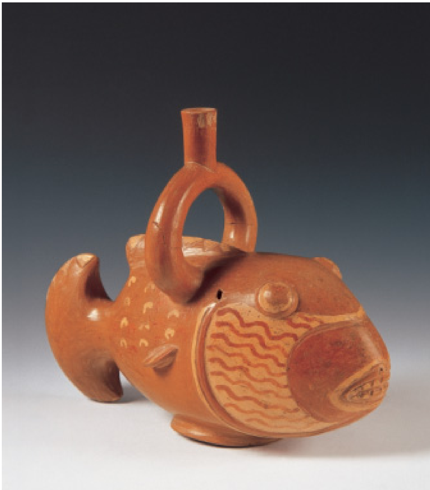
Fig. No. 106.- Representación escultórica de un pez. Museo Arqueológico Rafael Larco Herrera (105-004-006)