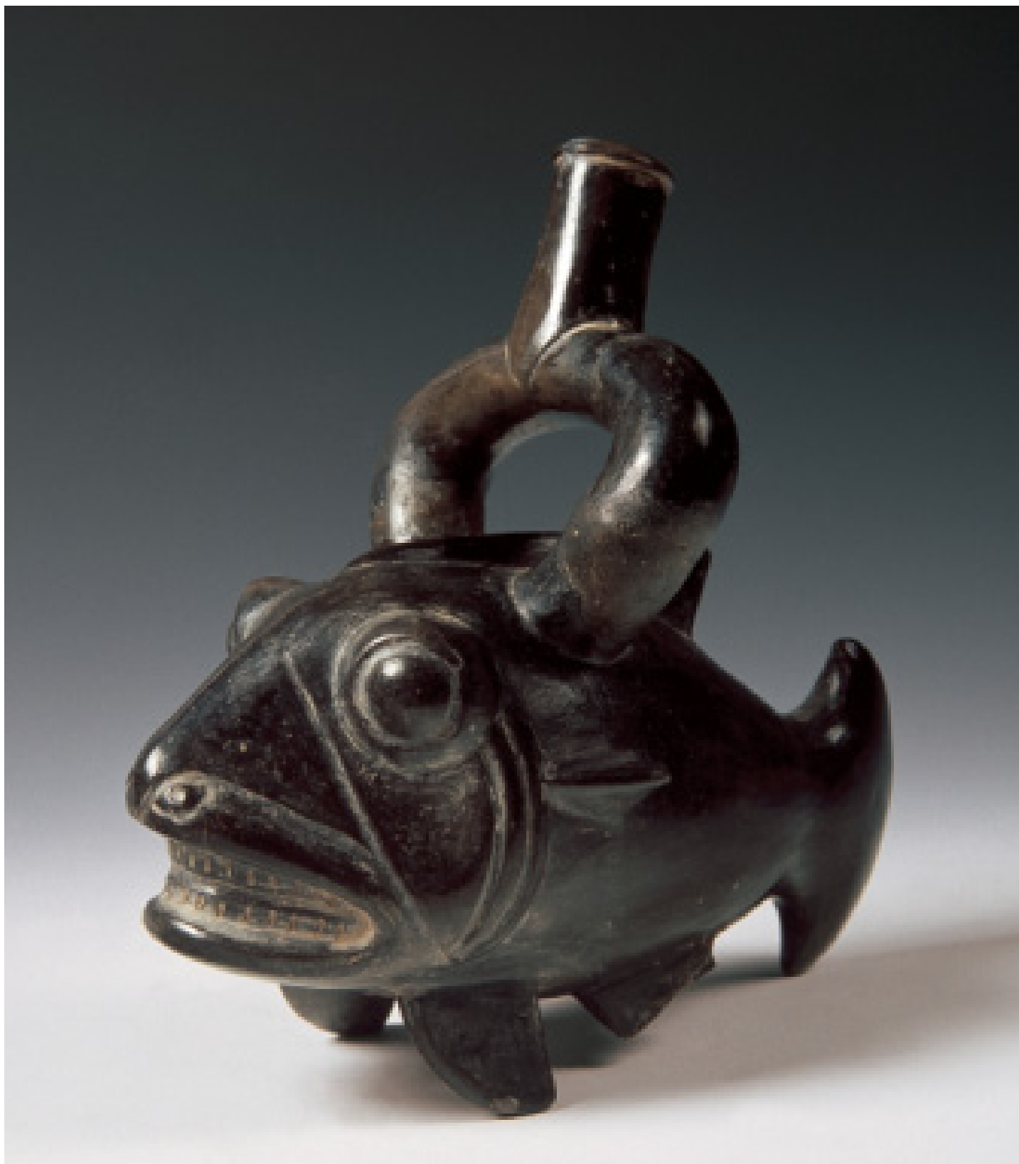
Fig. No. 105.- Cerámica mochica que representa el cuerpo de un pez. Museo Arqueológico Rafael Larco Herrera (105-004-001)