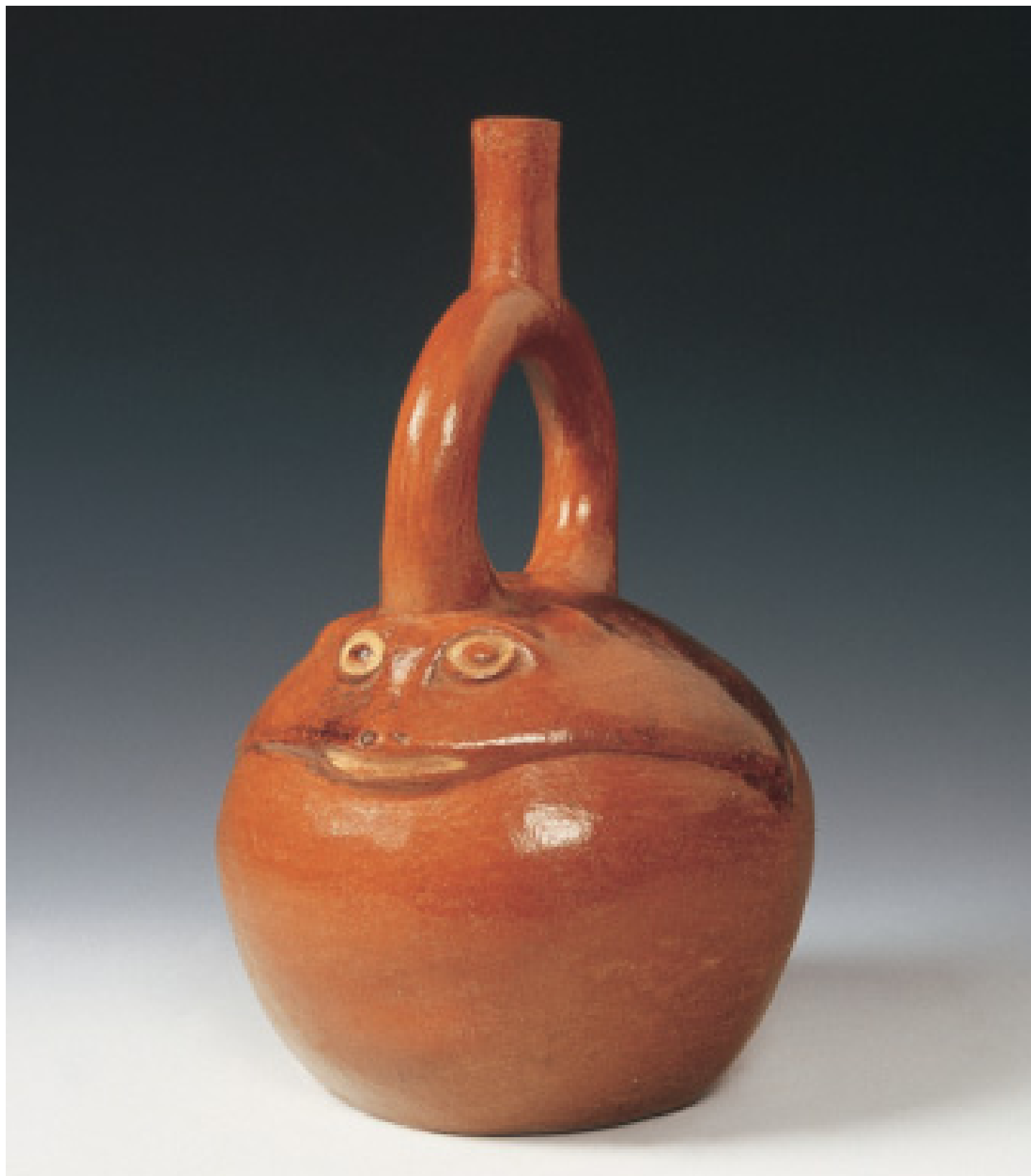
Fig. No. 107.- Pez raya ( Myliobatis aquila ). Museo Arqueológico Rafael Larco Herrera (106-003-011)