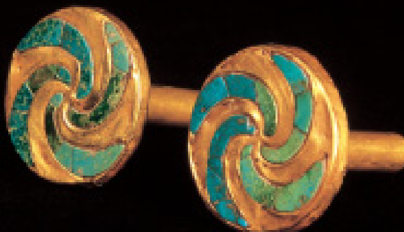
Fig. No. 155.- Orejeras de oro y turquesas con motivos de olas. Museo Arqueológico Rafael Larco Herrera