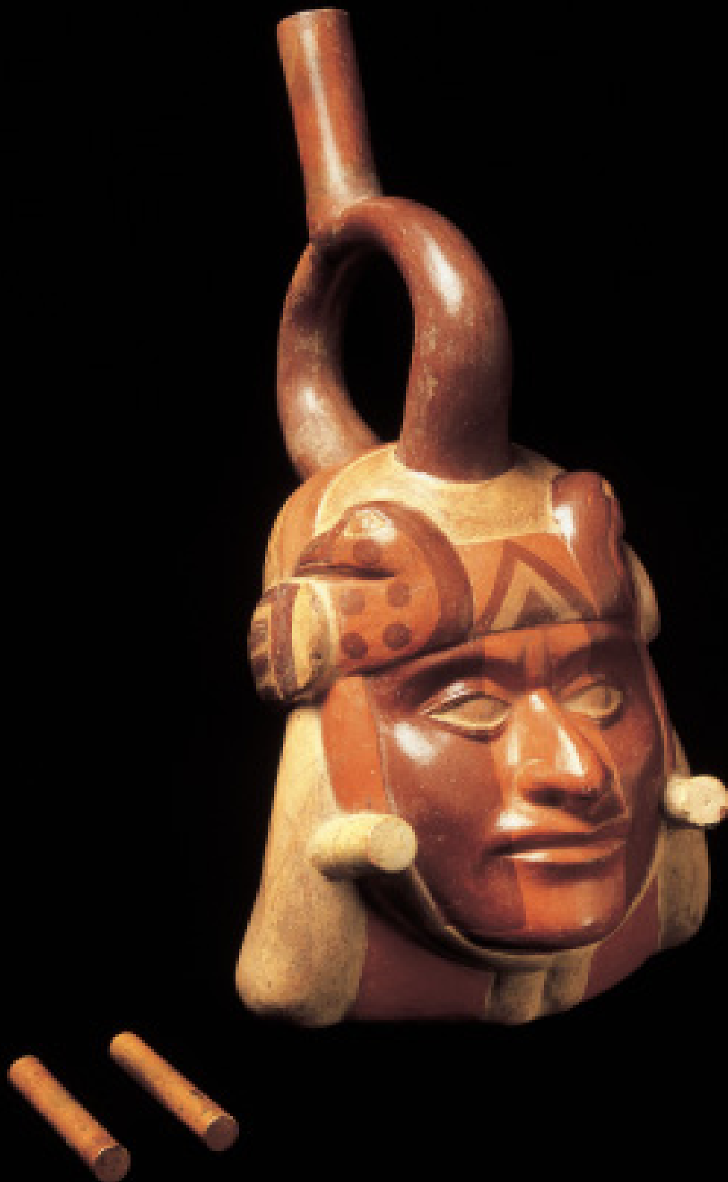
Figs. Nos. 156 y 157.- Composición. Orejeras tubulares de oro y pieza cerámica que muestra el uso de las orejeras. Museo Arqueológico Rafael Larco Herrera