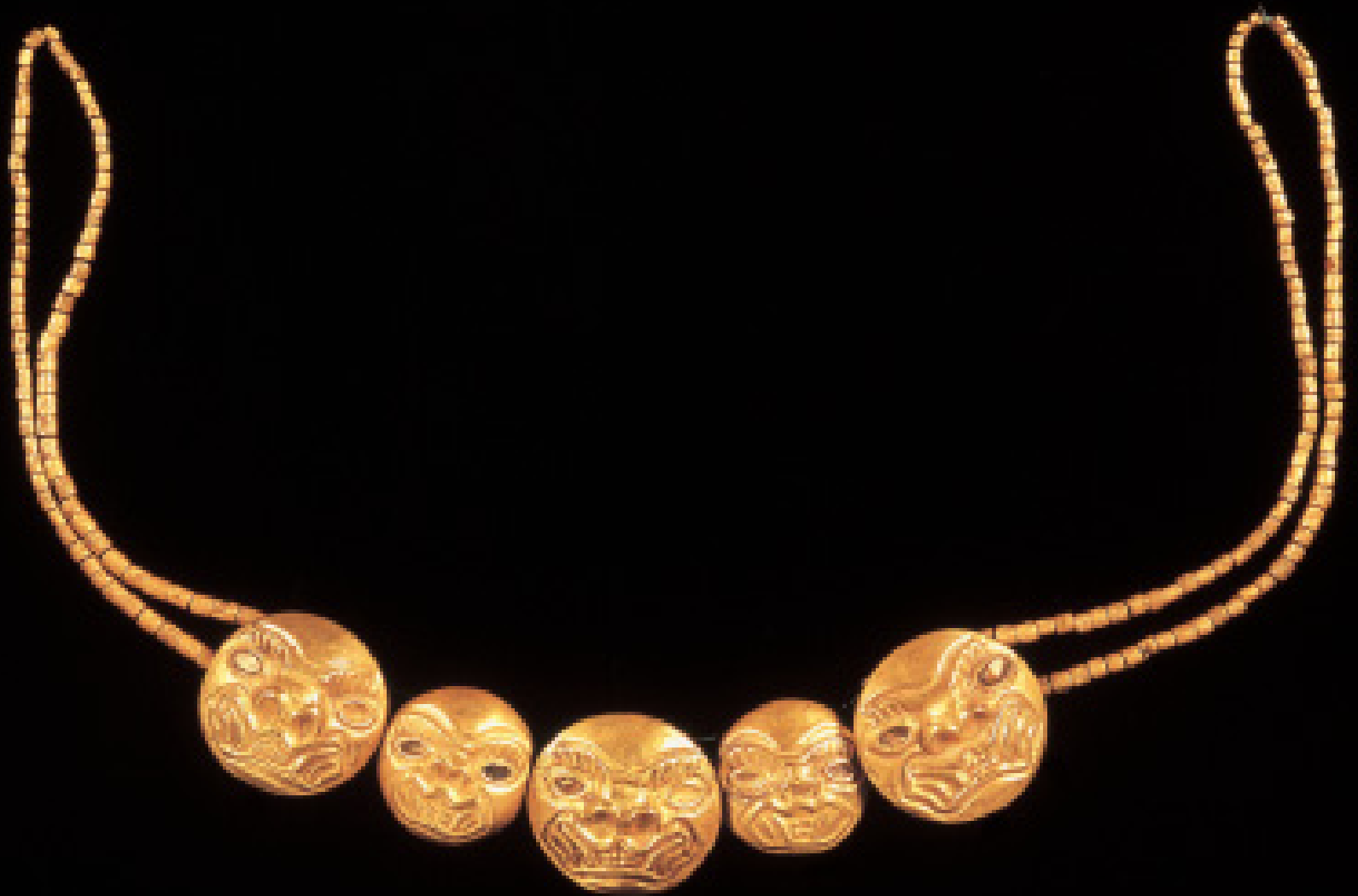
Fig. No. 151.- Collar de oro formado con cuentas de cabezas de felino, cuyos ojos están hechos de incrustaciones de concha de perla. Museo Arqueológico Rafael Larco Herrera (XSB-005-005)