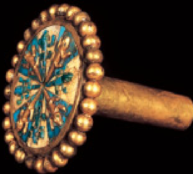
Fig. No. 152.- Orejera vista de costado. Museo Arqueológico Rafael Larco Herrera (XSB-008-C06)