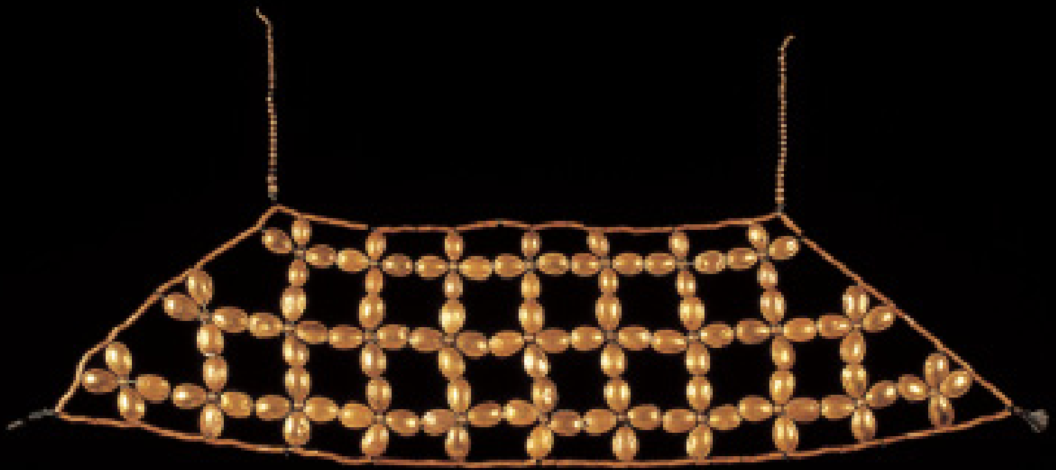
Fig. No. 158.- Adorno de vestido de oro en forma de pepas de zapallo. Museo Arqueológico Rafael Larco Herrera (XSB-009-C01)