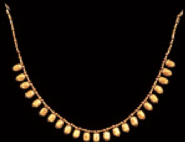
Fig. No. 160.- Collar formado por representaciones de sapo de oro con los ojos hechos de incrustaciones de turquesa. Museo Arqueológico Rafael Larco Herrera (XSB-005-B11)