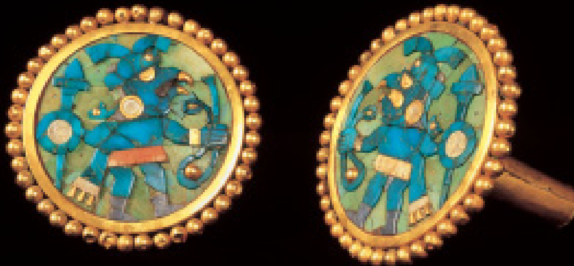
Fig. No. 154.- Orejeras de oro con incrustaciones de turquesa, pirita y concha de spondylus con representaciones de ave guerrera con maza y porra. Museo Arqueológico Rafael Larco Herrera