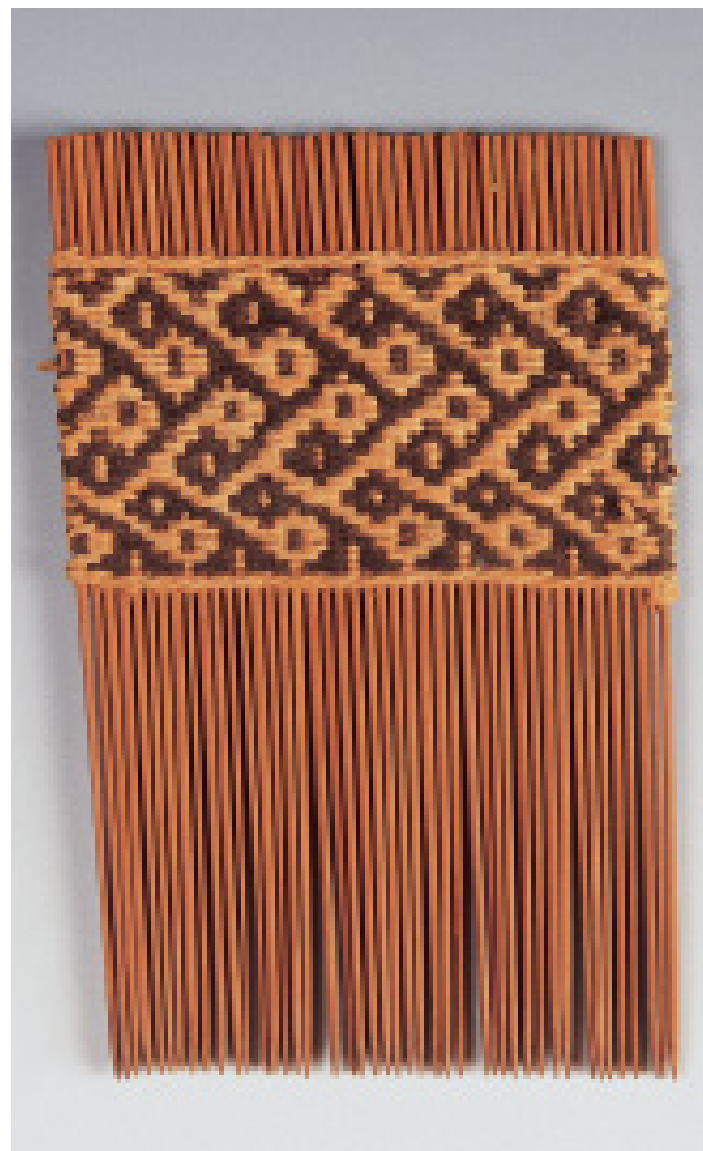
Figs. Nos. 209 A, B y C.- Vistas de peines utilizados especialmente para desenredar los hilos durante el tejido. Museo Arqueológico Rafael Larco Herrera (XST-003-010; XST-003-A04; XST-005-015)

interesante pieza, por lo que consideramos inoficioso hacer una descripción de ella.