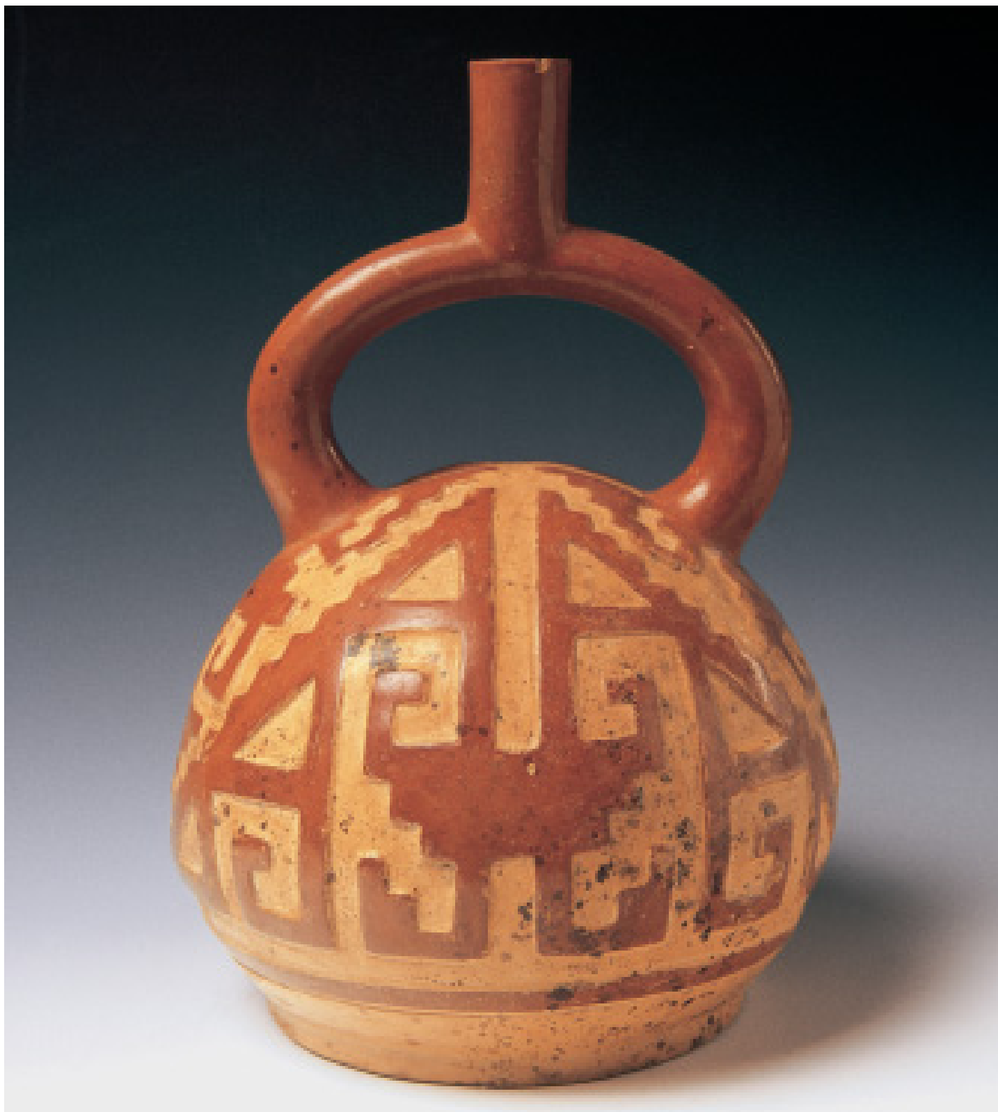
Fig. No. 212.- Ceramio mochica que nos muestra un relieve geométrico, que también aparece en el tejido que presentamos en la figura No. 211 de la cultura Chimú. Museo Arqueológico Rafael Larco Herrera (113-004-004)